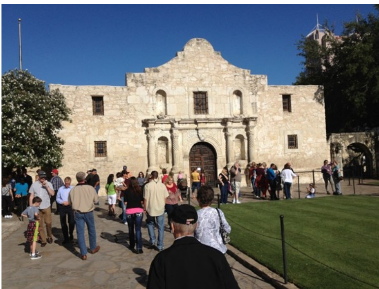
The 'Alamo', een belangrijke toeristische attractie in San Antonio

Het programma van de Amerikaanse congressen zit over het algemeen volgepakt met interessante sessies van de vroege ochtend tot avond, een mix van parallele seminars/workshops en plenaire lezingen. Ook bij dit congres was dat het geval. Het meeste indruk hebben de plenaire sessies op mij gemaakt, en dan vooral die sessies die over nieuwe, digitale ontwikkelingen gingen. 'Indexing in the age of ebooks' van Joshua Tallent was zo'n sessie bijvoorbeeld en de sessie die een update behandelde van de Digital Trends Task Force (DTTF) over de nieuw ontwikkelde index-standaard voor Epub3.